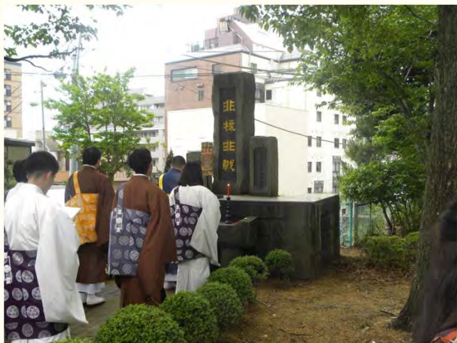
毎月9日に勤められる 「非核非戦定例法要」の様子